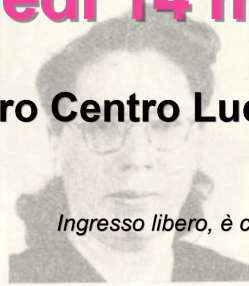
Teresa Noce (comunista)