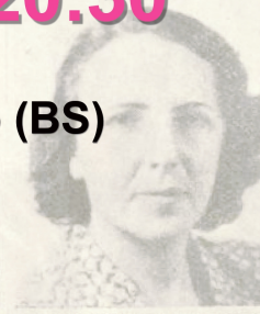
Maria Maddalena Rossi (comunista)