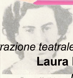
Teresa Mattei (comunista)