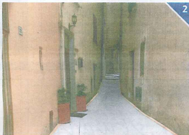
LE STRADE - A Montisola prima e Sulzano poi, le vie che portano al Ponte, in questi giorni vengono ricoperte da uno strato di feltro bianco. Poi, al pari della passerella galleggiante, sarà steso il telo giallo cangiante