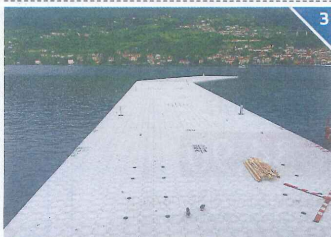
VERSO IL TRAGUARDO - L'ultimo troncone dell'opera d'arte che dal 18 giugno al 3 luglio cambierà la geografia lacustre ha cominciato a prendere forma. Montisola sarà presto collegata alla terraferma di Sulzano