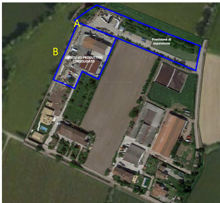
Inquadramento ambiti produttivo di ampliamento A e potenziamento B

L'estratto grafico di cui all'allegato II alla presente deliberazione che qui si richiama integralmente riporta l'inquadramento ambiti produttivo di ampliamento A e potenziamento B vedere allegato 2;