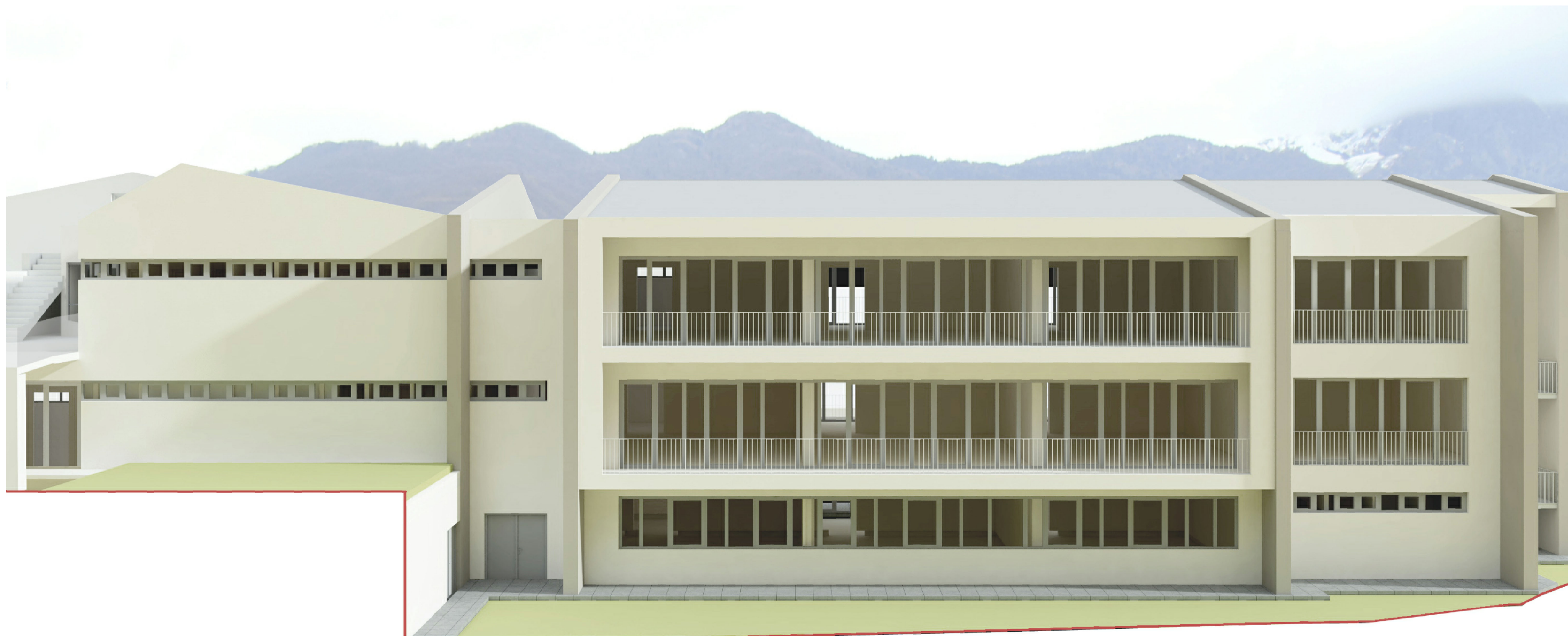
RENDER DI PROGETTO - VISTA B ( VIA FOLGORE )