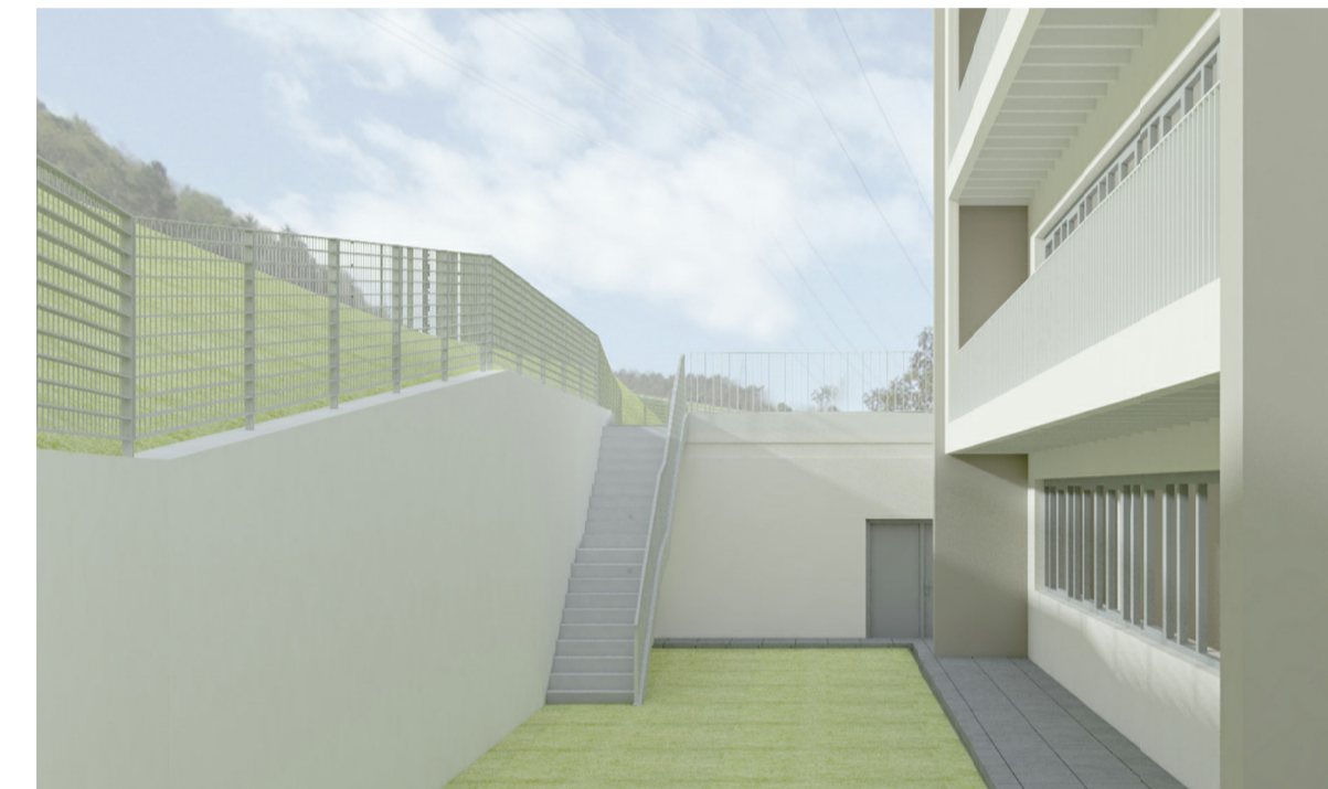
RENDER DI PROGETTO VISTA C PIANO TERRA (LATO STRADA)