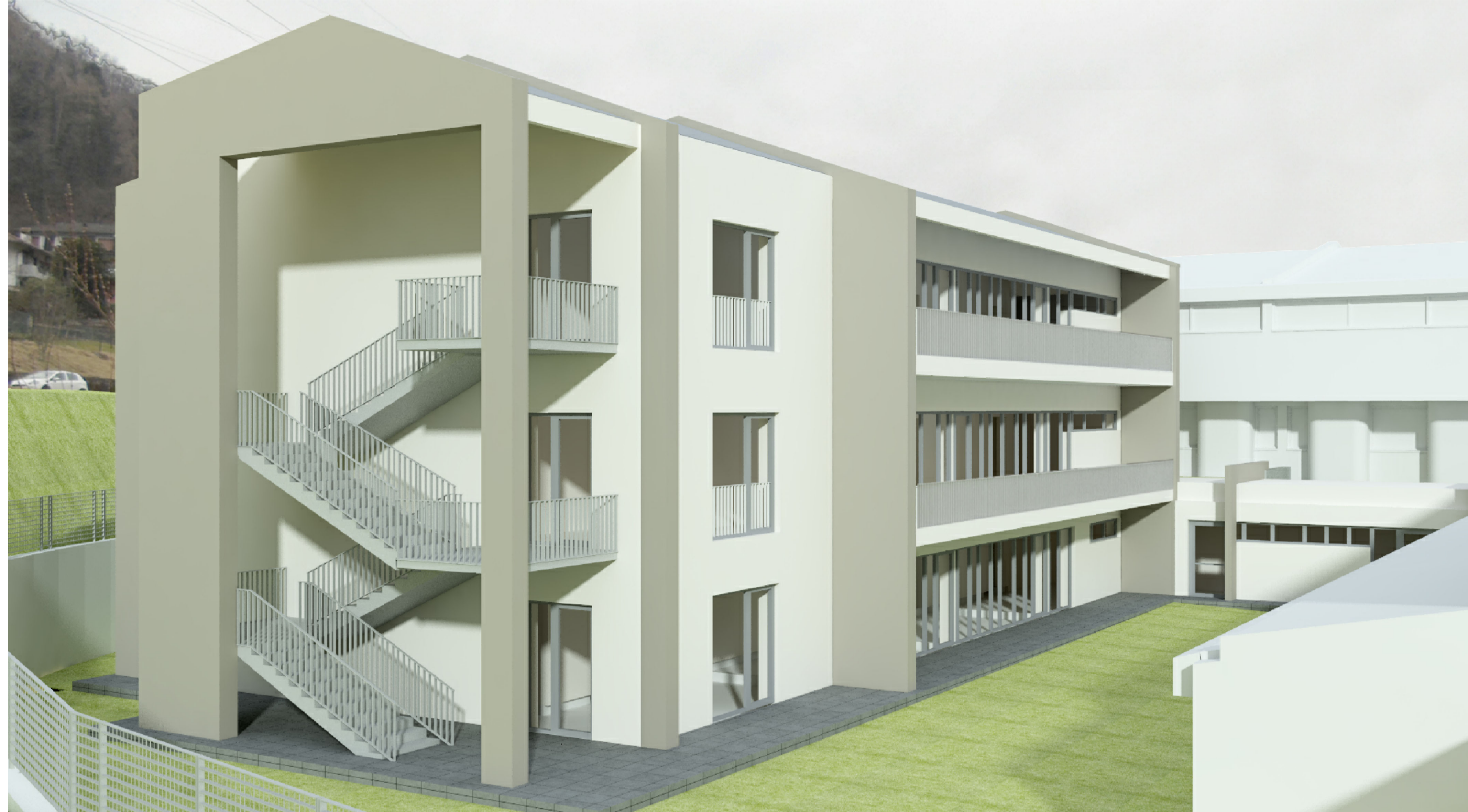
RENDER DI PROGETTO - VISTA A (CORTE INTERNA)