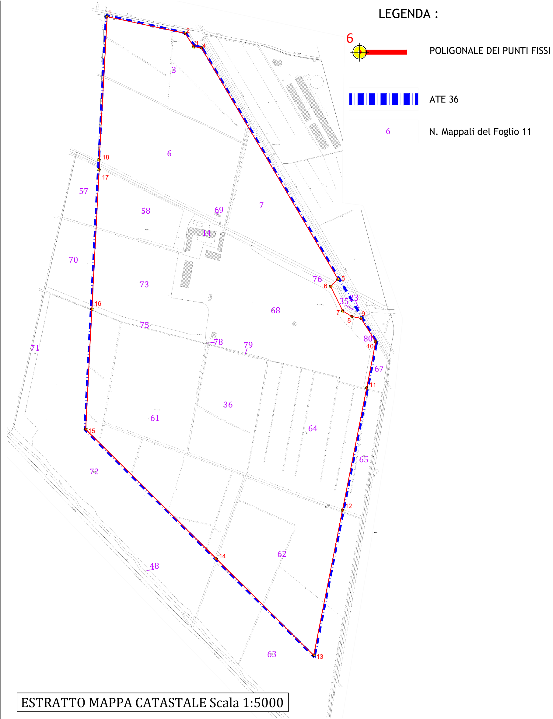
ESTRATTO MAPPA CATASTALE Scala 1:5000